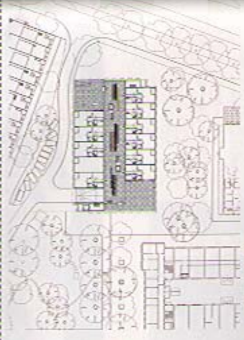
Planta tipo y orientación